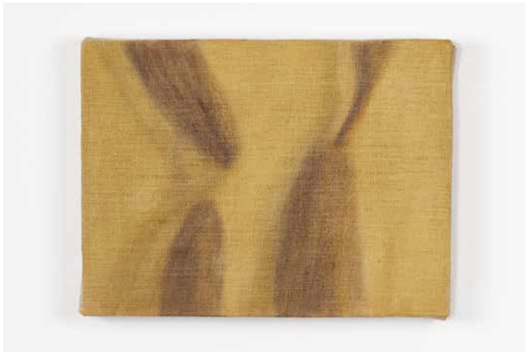
In alto / Up: Eleonora Mariani Loro che sono arrivati (III) , 2025 olio su lino oil on linen cm 10x20