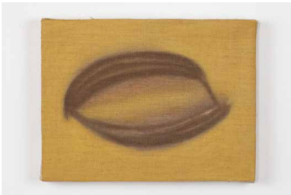
In basso / Down: Eleonora Mariani Quelli che non sono mai arrivati (II) , 2025 olio su lino oil on linen cm 10x20

EB: Nel testo per la mostra, Viola Cenacchi scrive che la tua ricerca si avvicina a quella di Delaine Le Bas per una “spiccata sensibilità femminile”. Cosa pensi di questo aspetto che vi lega?