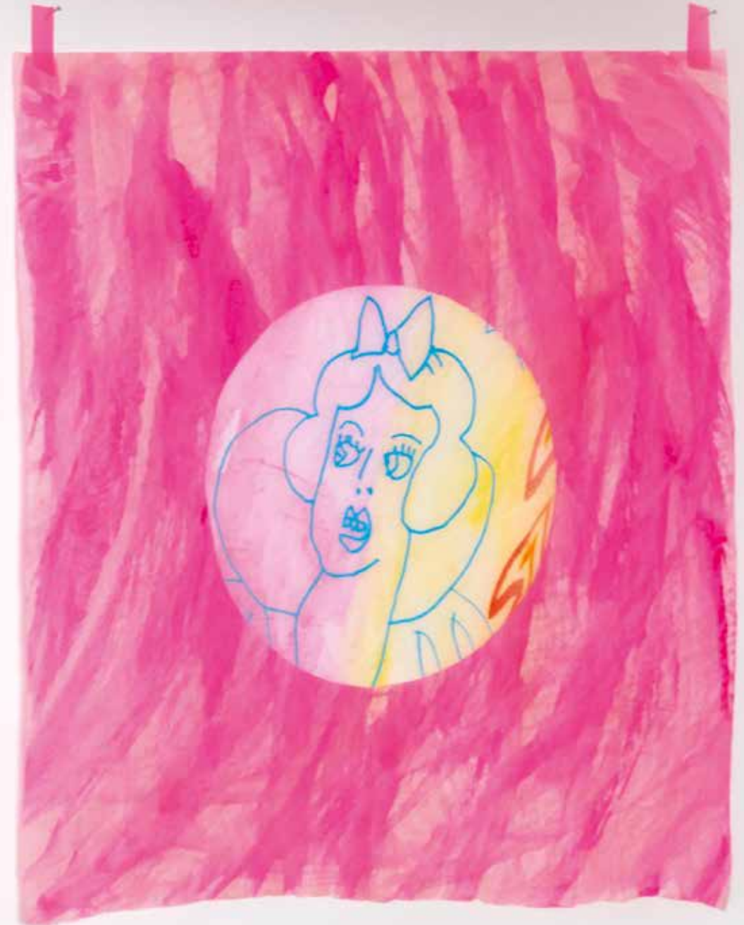
Delaine Le Bas SNOW WHITE , 2025 pittura acrilica su carta velina con nastro di carta acrylic paint on tissue paper with paper tape cm 51.5x49.5