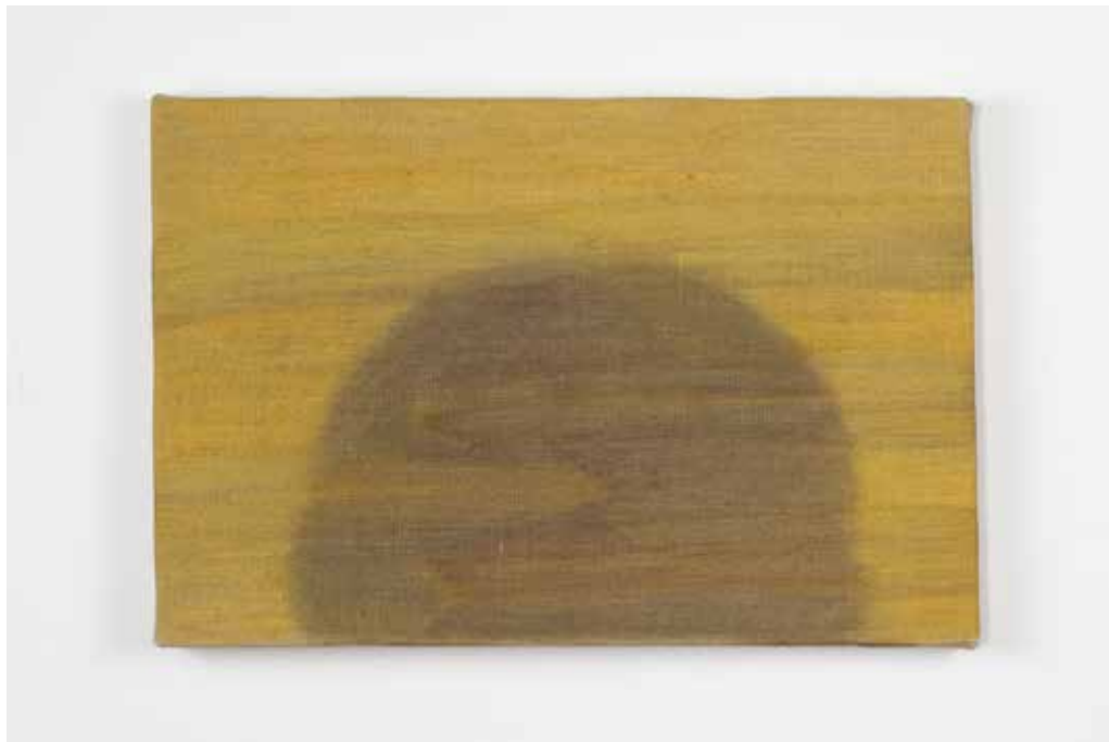
In alto / Up: Eleonora Mariani Quelli che non sono mai arrivati (IV) , 2025 olio su lino oil on linen cm 20x30