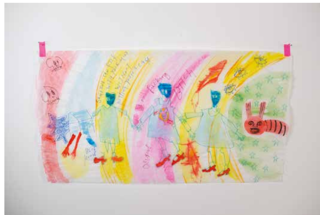
In alto / Up: Delaine Le Bas TWO RED FACES OVER THE SEA , 2025 colori acrilici e acquerelli su carta velina con nastro adesivo di carta acrylic paint and watercolour on tissue paper with paper tape cm 32x60