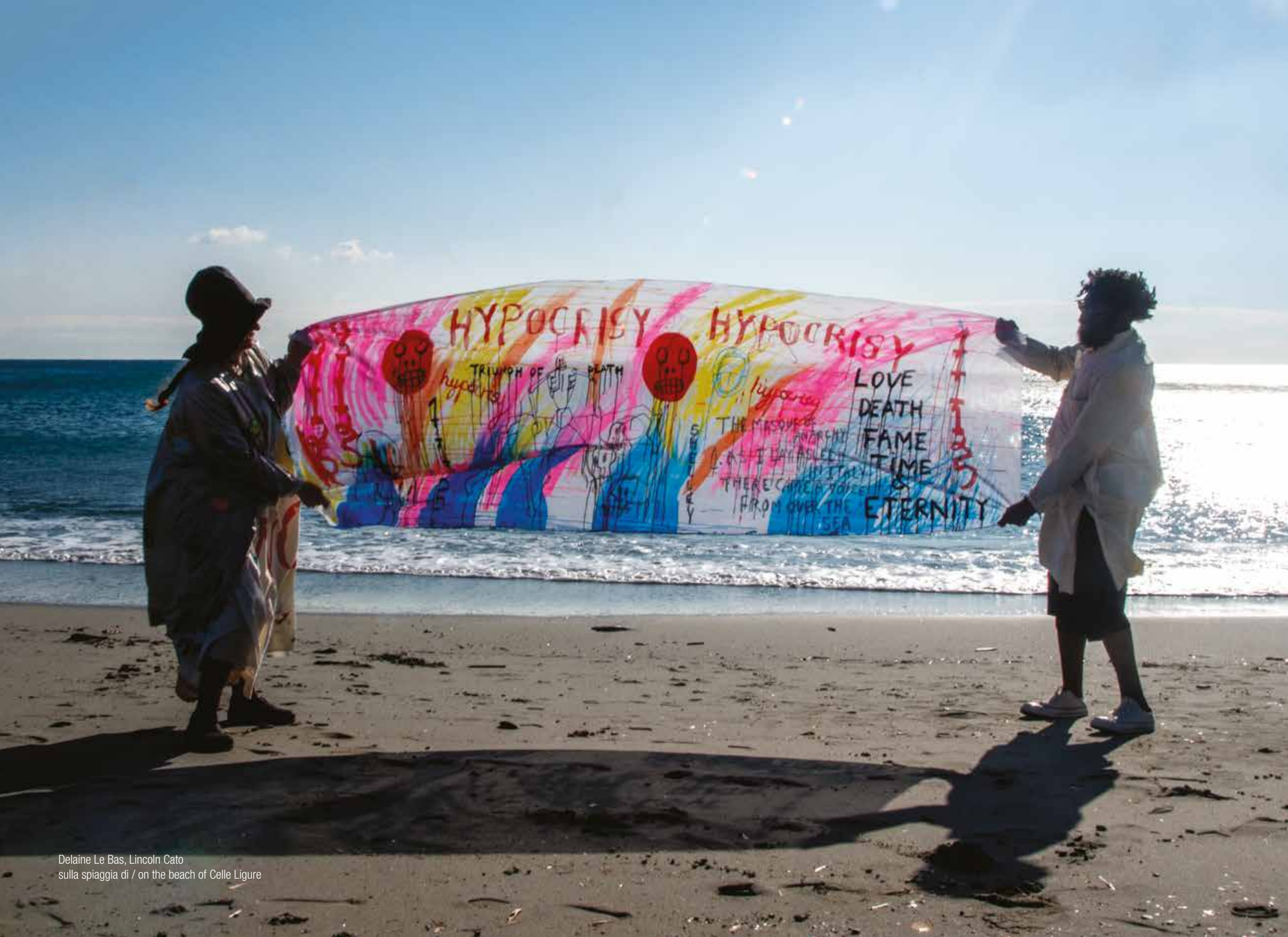
Delaine Le Bas, Lincoln Cato sulla spiaggia di / on the beach of Celle Ligure