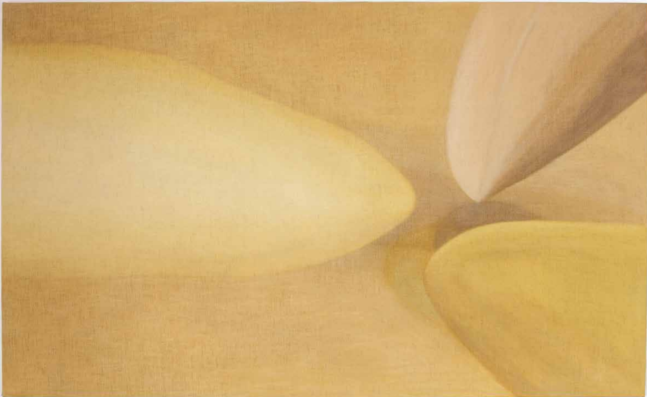
Eleonora Mariani Loro che sono arrivati (II) , 2025 olio su lino oil on linen cm 77x125