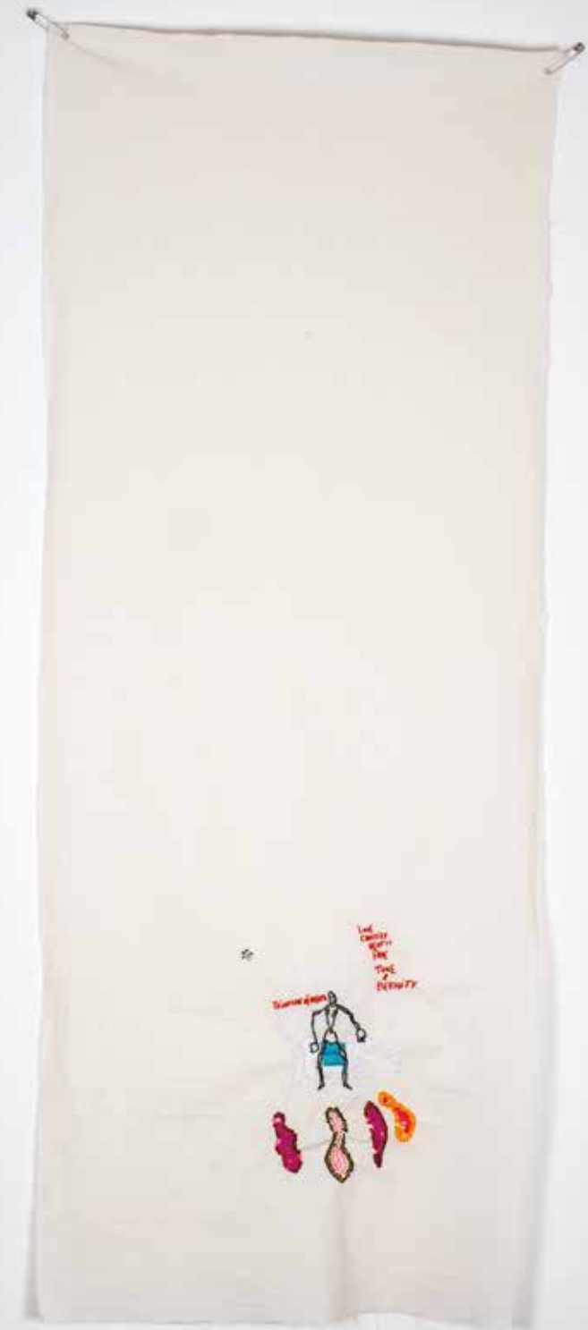
Delaine Le Bas TRIUMPH OF DEATH , 2025 ricami e paillettes su tela di cotone embroidery and sequins on calico cm 139x53.5 approx.