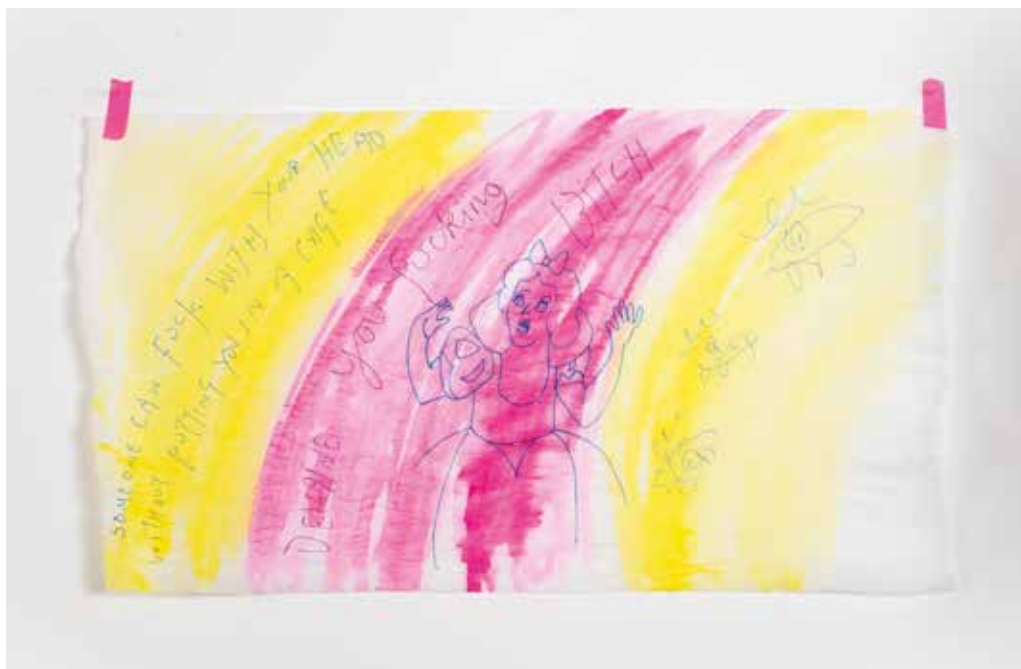
In alto / Up: Delaine Le Bas MI PARLA COME UNA CONCHIGLIA AL MIO ORECCHIO E IL ROSSO ESPLODE DALLA CARNE, 2025 pittura acrilica e acquerello su carta velina acrylic paint and watercolour on tissue paper cm 49.5x76 approx.